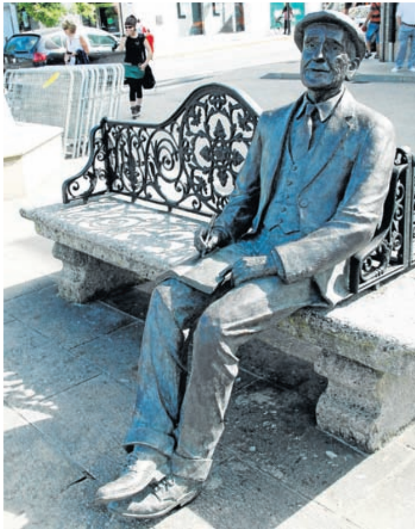
Estatua de Cabanillas diante do Concello de Cambados

Ademais, no Legado hai unha boa presenza de Álvaro Cunqueiro en